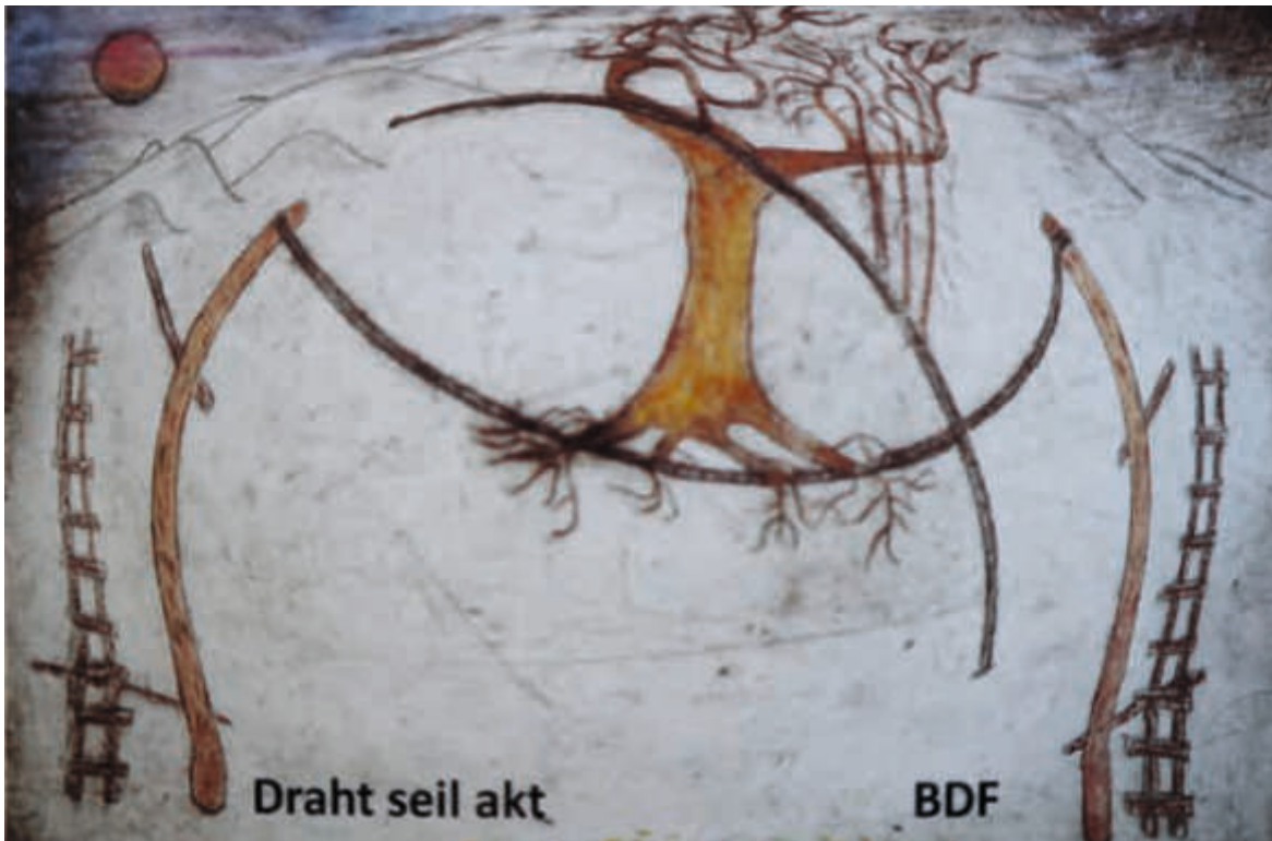
Der Gewinn: drei schöne BDF-Postkarten