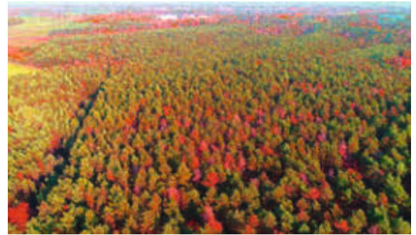
Durch den Rotfilter lassen sich die geschädigten Bäume recht gut erkennen.

ab. Häufig zeigten diese Stämme noch keine Blaufärbung. Vermutet wird, dass diese Bäume bereits abgestorben sind, die entsprechenden Anzeichen jedoch noch nicht zeigten. Möglicherweise sind auch andere Schadorganismen mit im Spiel. Das wird die Untersuchung durch die Nordwestdeutsche Forstliche Versuchsanstalt (NW-FVA) zeigen. Dieses massive Auftreten der Diplodia-Schädigung im Bereich von Giffhorn wird auch durch eine Bachelorarbeit untersucht. Man darf auf die Ergebnisse gespannt sein.