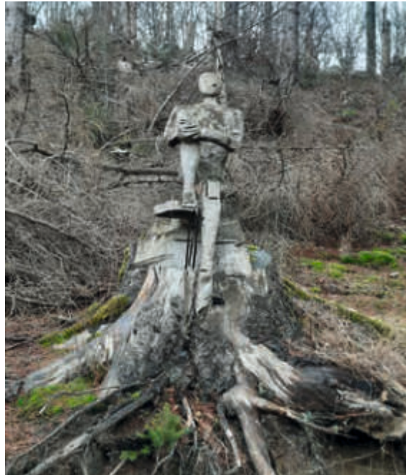
Den Waldburschen kümmern Überstunden nicht – Skulptur von Udo Volkmer in Schmallenberg-Bödefeld.

Dabei liegt es in der Pflicht des Arbeitgebers, Arbeitsplätze und -abläufe so zu organisieren und auszustatten, dass die Regelungen eingehalten werden können. Die bloße Begrenzung buchbarer Arbeitszeiten ist nicht ausreichend und treibt Beschäftigte in die Illegalität.