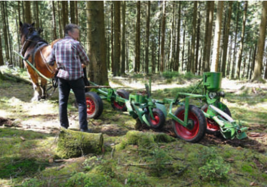
Die Vorführung der Weißtannensaat mittels pferdegezogenen Scheibenräumgeräts war als Teil des Projekts ein besonderes Ereignis.

In den zurückliegenden drei Projektjahren (2017 bis 2019) der Weißtannenoffensive konnten in zwölf Bundesländern 20 Informationsveranstaltungen zur Weißtanne durchgeführt werden. Von den knapp 1.300 Teilnehmenden bestätigte rund die Hälfte, dass sie bereits mit der Weißtanne arbeitet oder dies zukünftig plant. In Zusammenarbeit mit diesen Betrieben ist es im Folgeprojekt WEIßTANNE 2.0 das Ziel, die Weißtanne als Mischbaumart großflächig auf geeigneten Standorten einzubringen.