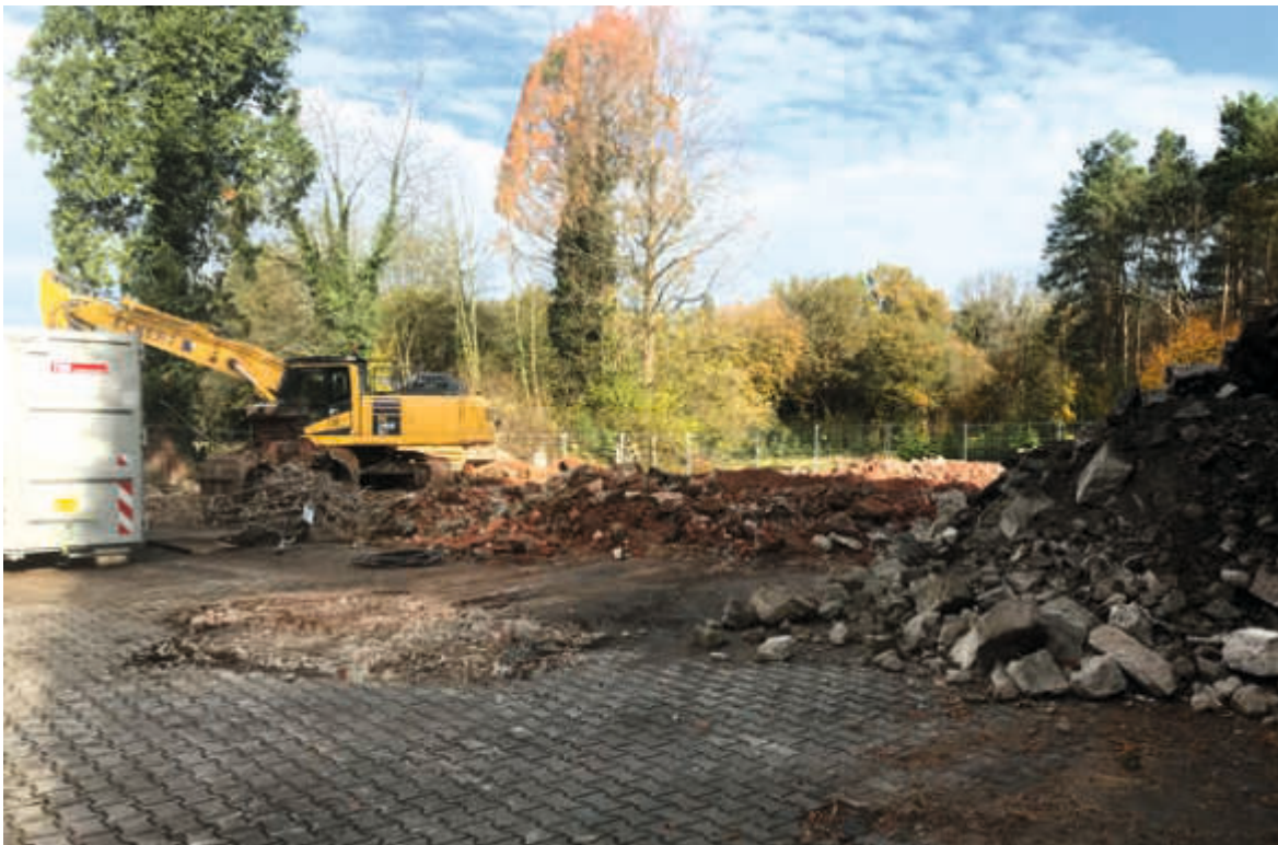
An dieser Stelle wird die neue Arbeitshalle entstehen.

Das Thema Wiederbewaldung wird uns mindestens das nächste Jahrzehnt intensiv beschäftigen. Engpass bleibt die Verfügbarkeit von geeignetem, herkunftsgesichertem Saat- und Pflanzgut. Die Bundesländer haben das durchweg erkannt. Hessen hat einen Plan.