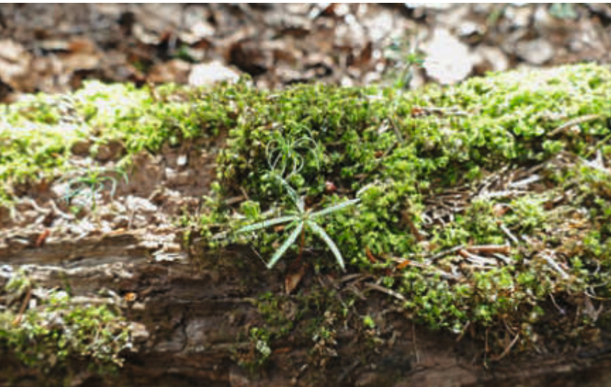
Die nächste Generation der Weißtannen steht bereit.