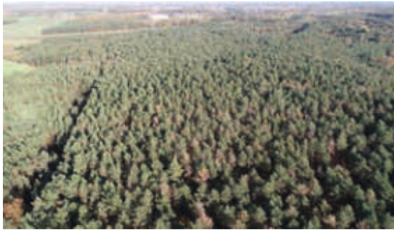
Ein Drohnenflug zeigt in etwa das Ausmaß der Schädigung. Nicht nur die braunen Kronen sind befallen, sondern auch die fahlgrünen.