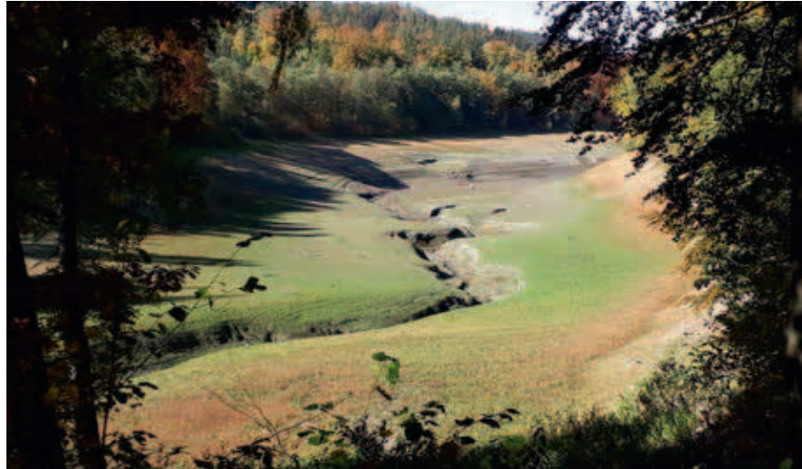
Wasserreservoir im Sauerland ohne Wasser

Das Bergische Land ist einer der Hotspots des Fichtensterbens in NRW. Ganze Täler sind gesäumt von dünnen Wäldern, ein unvorstellbarer Landschaftsschaden und wirtschaftlicher Verlust. Menschliche Unaufmerksamkeit, Zulauf während der Ausgangsbeschränkungen und die trockene Witterung führen zu gefährlichen Waldbränden.