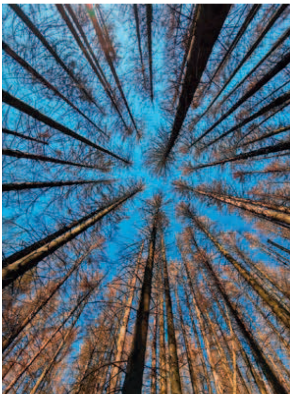
Kronen durrer Fichten im Bergischen Land

Für den Waldbesitz in NRW bedeutet das aktuelle Waldsterben eine riesige wirtschaftliche Katastrophe. Das Bereitstellen des Holzes für den Verkauf erfordert eine erhebliche Vorfinanzierung, denn der Auftragnehmer benötigt sein Geld, der Auftraggeber bekommt es aber erst später – wenn überhaupt, denn manche Sortimente sind auf unabsehbare Zeit am Markt unverkäuflich. Jeder Festmeter verkauftes Holz stellt einen Fortschritt dar, wobei der Ertrag kaum noch die Kosten deckt.