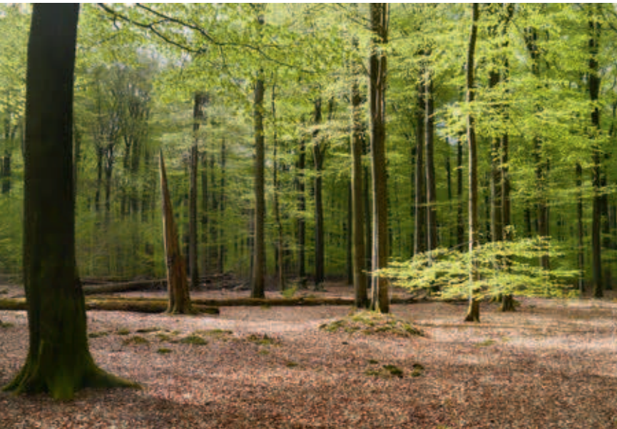
Der Naturwald Limker Strang im Solling im Jahr 2018