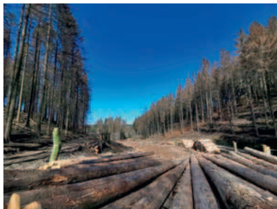
Aufarbeitung im Bergischen Land