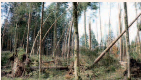
Wetterextreme und Stürme nehmen zu. Die Schäden an den Wäldern sind stellenweise dramatisch.