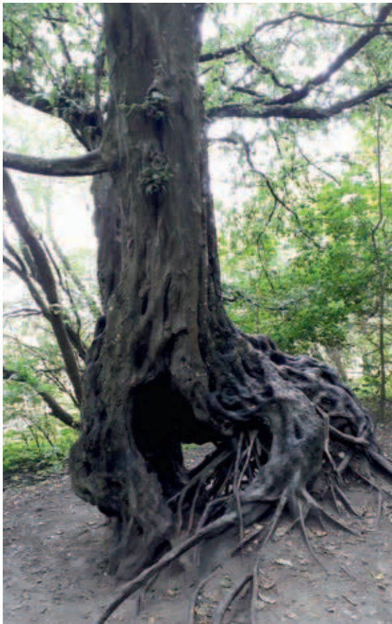
Auch Laubholz kämpft ums Überleben

Was zwei Dürrejahre und ein weiterer milder Winter für unsere Laubhölzer bedeuten, hat sich im Jahr 2019 angedeutet; nähere Erkenntnisse bleiben abzuwarten. Die mancherorts gepriesene Devise „LH first“ ist wohl nicht mehr haltbar.