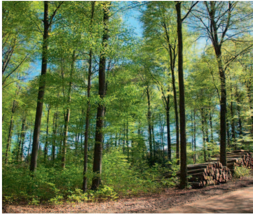
Die Wälder im Stadtforstamt Remscheid auf dem Weg zum gemischten Dauerwald

Die quälenden und laufenden Abfragen zur Ermittlung von Festmetern und Schadflächen an Verbände und Forstbehörden sind doch spätestens in 14 Tagen, wenn diese Zahlen auf Bundesländer- oder Bundesebene zusammengetragen und ausgewertet wurden, wieder veraltet und daher keineswegs valide.