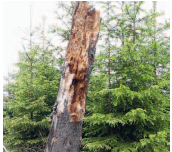
Perspektiven für die Zukunft auf dem Kyrillpfad in Schmalenberg-Schanze

Was zwei Dürrejahre und ein weiterer milder Winter für unsere Laubhölzer bedeuten, hat sich im Jahr 2019 angedeutet; nähere Erkenntnisse bleiben abzuwarten. Die mancherorts gepriesene Devise „LH first“ ist wohl nicht mehr haltbar.