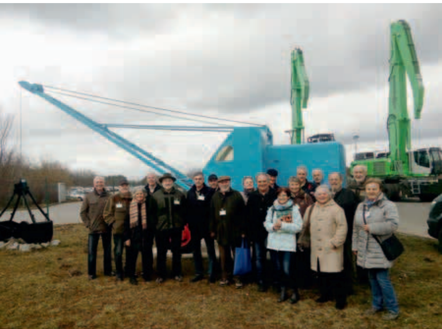
Die Oberpfälzer Senioren beim Maschinenbauer SENNEBOGEN

Ziel des heurigen Informationstreffens der Oberpfälzer Senioren war das Industriegebiet Wackersdorf. Einst für die Wiederaufbereitungsanlage (WAA) vorgesehen, wurden in der Folge zahlreiche Industrien mit vielen Arbeitsplätzen als Ersatz der ehemaligen Bayerischen Braunkohlen-Industrie angesiedelt.